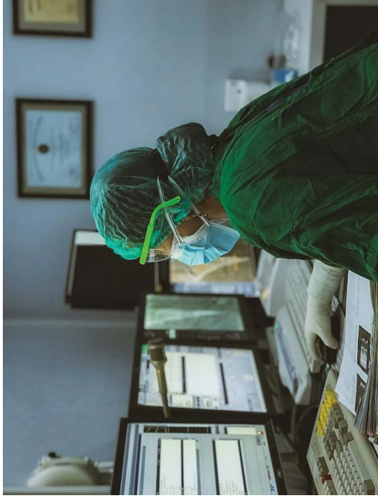
Abbildung 1: Im Krankenhaus: In den letzten 10 Jahren hat das internationale Forschungprojekt CompBioMed dazu beigetragen, dass Ärztinnen heute mehr und mehr Software und Tools nutzen können, um Behandlungen zunächst digital zu testen oder zu praktizieren.

CompBioMed hat eine Menge Anstöße zur Digitalisierung in der Medizin und Pharmaforschung gegeben, ob allerdings eine dritte Finanzierungsphase möglich ist, ist noch nicht entschieden.