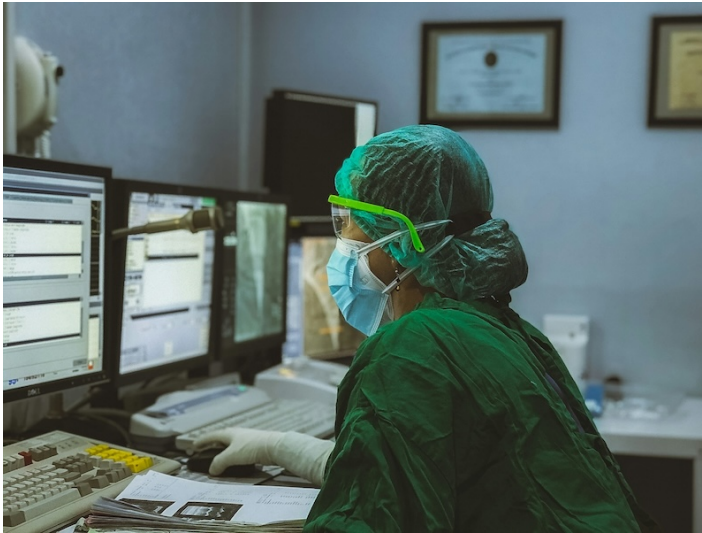
Abbildung 1: Im Krankenhaus: In den letzten 10 Jahren hat das internationale Forschungsprojekt CompBioMed dazu beigetragen, dass Ärztinnen heute mehr und mehr Software und Tools nutzen können, um Behandlungen zunächst digital zu testen oder zu praktizieren.

CompBioMed hat eine Menge Anstöße zur Digitalisierung in der Medizin und Pharmaforschung gegeben, ob allerdings eine dritte Finanzierungsphase möglich ist, ist noch nicht entschieden.